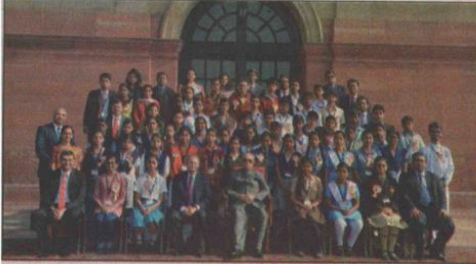
ଜାଗା ବିଲଡିଂ ଇଞ୍ଜିଆ ସ୍କୁଲ ପୁରସ୍କାର ପ୍ରତିଯୋଗିତାରେ କୃତି ପ୍ରତିଯୋଗୀଙ୍କ ସହିତ ଗାଷ୍ଟପତି ପ୍ରଣବ ମୁଖାର୍ଜୀ