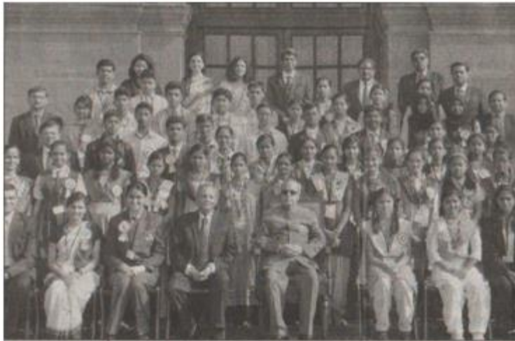
ଟାଟା ବିଲ୍ଡିଂ ଇଞ୍ଜିଆ ସ୍କୁଲ ଏମ୍ପ୍ଲଏ କମ୍ପେଟିସନ କେ ବିଜେତା ଛାତ୍ର ନର୍ସି ଦିଲ୍ଲୀ ମେଁ ରାଷ୍ଟ୍ରପତି ପ୍ରଣବ ମୁଖାର୍ଜୀ କେ ସାଥେ ଫଟୋ ସତ୍ତ କେ ଦିଆନ ।