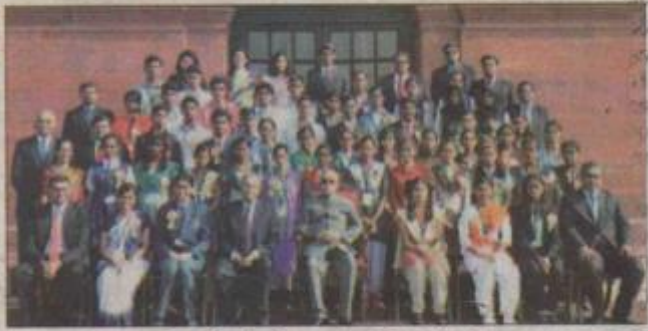
୨୦୦୬ରେ ଆରମ୍ଭ ହୋଇଥିବା ଏହି ପ୍ରତିଯୋଗିତା ପ୍ରତିଯୋଗିତା। ବିଭିନ୍ନ ଭାଷାରେ ରାଷ୍ଟ୍ରୀୟ ସ୍ତରରେ ଏହି ପ୍ରତିଯୋଗିତା ଅନୁଷ୍ଠିତ ହୋଇଆସୁଛି।

ଭୁବନେଶ୍ୱର, ୩୦/୧୨ (ଭୁବନେ): ଟାଟା ବିଜ୍ଞା ଇଂରାଜୀ ସ୍କୁଲ ପ୍ରବନ୍ଧ ପ୍ରତିଯୋଗିତାର ସପ୍ତମ ଓ ଅଷ୍ଟମ ସ୍ତରରେ ବିଭେଦନାତ୍ମକ ନୂଆପିଲାପୁଅ ରାଷ୍ଟ୍ରପତି ଭବନରେ ଭାରତର ରାଷ୍ଟ୍ରପତି ପ୍ରବନ୍ଧ ପ୍ରତିଯୋଗିତାରେ ବିଜେତା ହେଲେ। ଟାଟା ବିଜ୍ଞା ଇଂରାଜୀ ସ୍କୁଲ ପ୍ରବନ୍ଧ ପ୍ରତିଯୋଗିତାରେ ବିଭେଦନାତ୍ମକ ନୂଆପିଲାପୁଅ ରାଷ୍ଟ୍ରପତି ଭବନରେ ବିଜେତା ହେଲେ। ଟାଟା ବିଜ୍ଞା ଇଂରାଜୀ ସ୍କୁଲ ପ୍ରବନ୍ଧ ପ୍ରତିଯୋଗିତାରେ ବିଭେଦନାତ୍ମକ ନୂଆପିଲାପୁଅ ରାଷ୍ଟ୍ରପତି ଭବନରେ ବିଜେତା ହେଲେ।