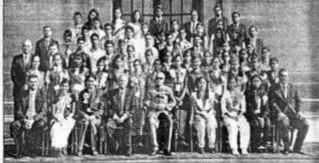
राष्ट्रपति के साथ विजेता प्रतिभागी।

जमशेदपुर। टाटा बिल्डिंग इंडिया स्कूल निबंध प्रतियोगिता के राष्ट्रीय स्तर के विजेताओं को नई दिल्ली स्थित राष्ट्रपति भवन में भारत के राष्ट्रपति प्रणब मुखर्जी से पोट करने का अवसर मिला। इन विजेताओं को राष्ट्रपति भवन के दौरे पर भी जाने का मौका मिला। 2006 में शुरू हुई टाटा बिल्डिंग इंडिया स्कूल निबंध प्रतियोगिता भारत को सबसे बड़ी राष्ट्रीय स्तर की प्रतियोगिता है जो कक्षा 6 से 12 तक के छात्रों को राष्ट्र निर्माण के बारे में अपने विचारों को व्यक्त करने का अवसर प्रदान करती है। 2012-13 के एडिशन का आयोजन 10 अलग-अलग भाषाओं-अंग्रेजी, हिंदी, बंगाली, गुजराती, तमिल, मराठी, कन्नड़, ओडिशा, तेलुगू और मलयालम में किया गया था। 2013-14 में दो भाषाओं-बंगाली और असमिया को भी शामिल किया गया और इस तरह प्रतियोगिता के दायरे में शामिल भाषाओं की संख्या बढ़ाकर बढ़ाई गई थी। हर एडिशन में देशभर के 170 से ज्यादा शहरों के 6500 से 7000 स्कूलों के 30