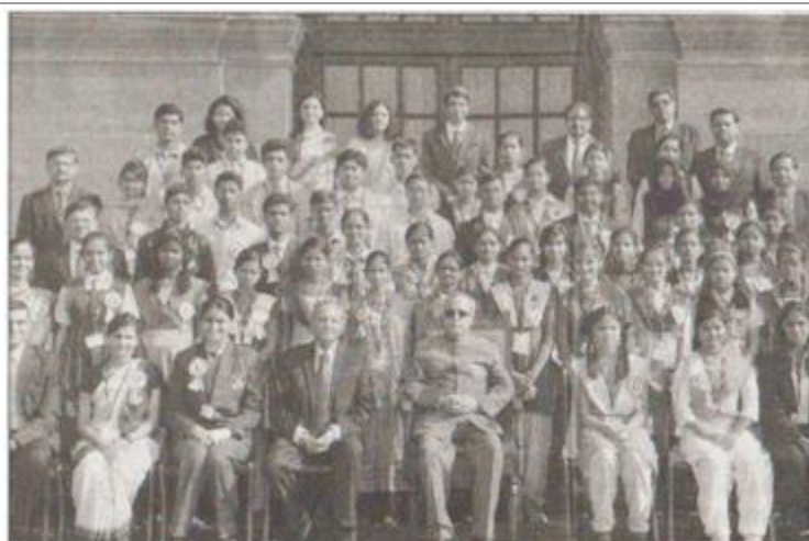
टाटा बिल्डिंग इंडिया स्कूल एसे कंपटीशन के विजेता छात्र नई दिल्ली में राष्ट्रपति प्रणव मुखर्जी के साथ फोटो सत्र के दौरान।