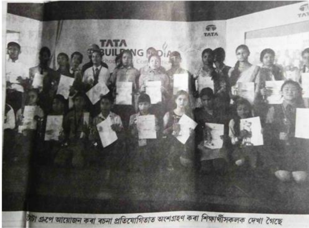
টাটা গ্ৰুপে আয়োজন কৰা বচনা প্রতিযোগিতাত অংশগ্ৰহণ কৰা শিক্ষার্থীসকলক দেখা গৈছে