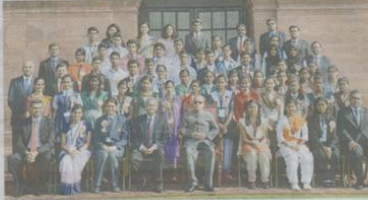
National winners of the Tata Essay competition pose with President Pranab Mukherjee.

The national winners across the two editions were also felicitated