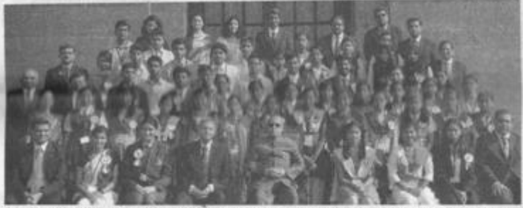
ഓറ്റ ബിൽഡിംഗ് ഇന്ത്യ സ്കൂൾ ഉപന്യാസ രചന മത്സരത്തിലെ ദേശീയ വിജയികൾ രാഷ്ട്രപതി പ്രണബ് മുഖർജിയോടൊപ്പം.