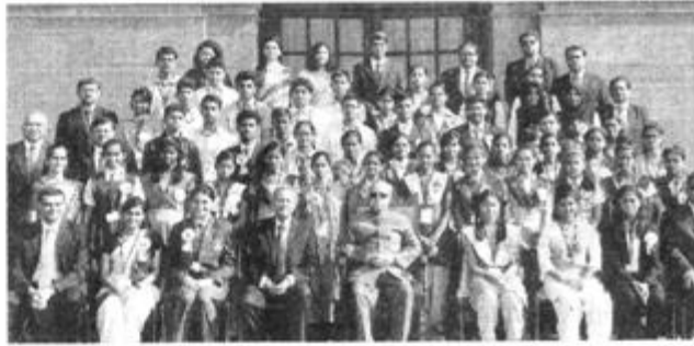
ಟಾಟಾ ಸಮೂಹದ 8ನೇ ವರ್ಷದ ವಾರ್ಷಿಕ ಪ್ರಬಂಧ ಸ್ಪರ್ಧೆ 'ಟಾಟಾ ಬಿಲ್ಡಿಂಗ್ ಇಂಡಿಯಾ ಶಾಲಾ ಪ್ರಬಂಧ ಸ್ಪರ್ಧೆ'ಯ ವಿಜೇತರು.