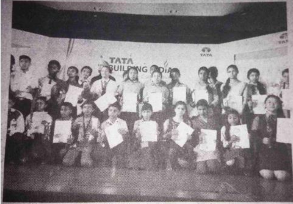
গুৱাহাটীত নগৰভিত্তিক টাটা বিল্ডিং ইণ্ডিয়া স্কুল বচনা প্রতিযোগিতা ২০১৪-১৫ বৰ্ষৰ বিজয়ীসকল, ফটো : ৰাজশ্ৰী বৰুৱা