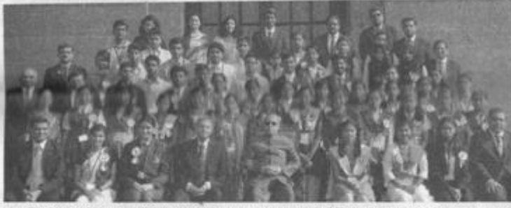
ഓറ്റ ബിൽഡിംഗ് ഇന്ത്യ സ്കൂൾ ഉപന്യാസ ചേർന്ന മത്സരത്തിലെ ദേശീയ വിജയികൾ രാഷ്ട്രപതി പ്രണബ് മുഖർജിയോടൊപ്പം.