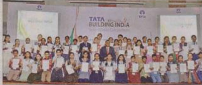
FELICITATED: The winners of the 'Tata Building India School Essay Competition 2014-15' with their certificates.

ST CORRESPONDENT reporters@sakaatimes.com