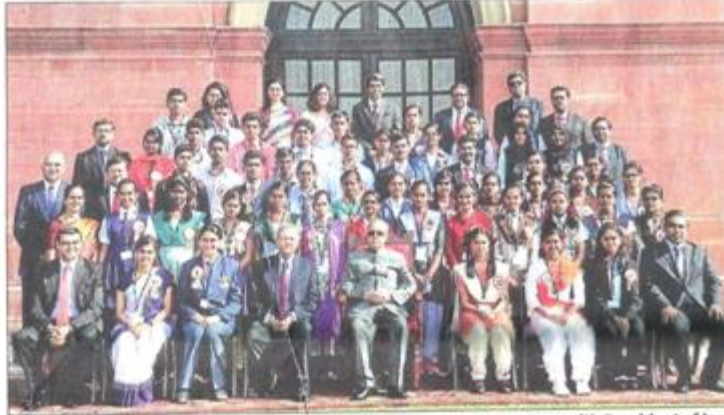
National winners of Tata Building India school essay competition, along with President of India Pranab Mukherjee at Rashtrapati Bhavan in New Delhi.

'Science & Technology for India' was the theme for the competition, said a press release.