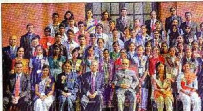
नई दिल्ली में राष्ट्रपति प्रणव मुखर्जी के साथ टाटा बिल्डिंग इंडिया स्कूल (टीबीआइएस) निबंध प्रतियोगिता के विजेता