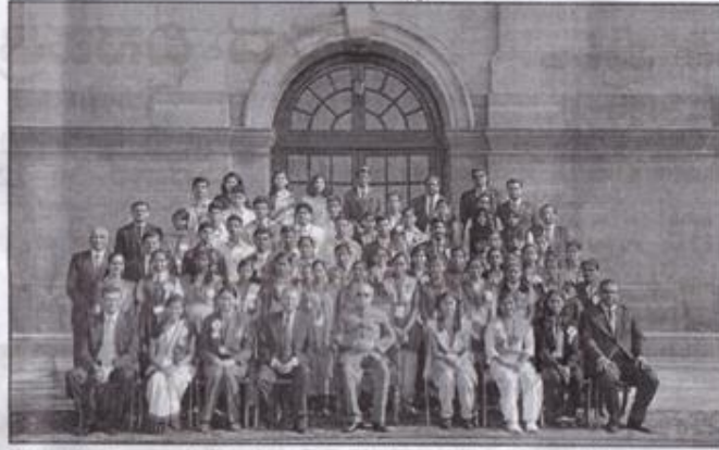
ಮುಖ್ಯಅತಿಥಿಯಾಗಿ ಭಾಗವಹಿಸಿ ವಿಜೇತರನ್ನು ಅಭಿನಂದಿಸಿದರು. ಈ ಸಂದರ್ಭದಲ್ಲಿ ಮಾತನಾಡಿ, ಭಾಗವಹಿಸಿದ ಎಲ್ಲರೂ, ವಿಜೇತರು ತಮ್ಮ ಪಾಲಕರು, ಶಿಕ್ಷಕರು, ಶಾಲೆ, ನಗರ ಮತ್ತು ರೇಶ ಹೆಮ್ಮೆ ವಿಜೇತರನ್ನು ಕೊಡುವಂತೆ ಮಾಡಿದ್ದಾರೆ ಎಂದರು. 2012-13ರಲ್ಲಿ ದೊಡ್ಡದೂ ಹಾಗೂ 2013-14ರಲ್ಲಿ 'ಕೆ.ಪರ್ವತ್ಯಾ' ದಿ ಆರ್ಥ್ ಸಿನಿಮಾ ಪ್ರದರ್ಶನವನ್ನು ನಂತರ