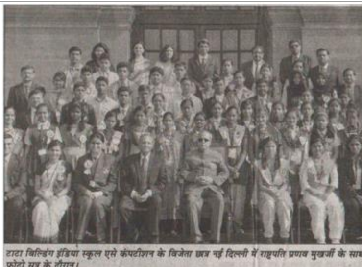
टाटा बिल्डिंग इंडिया स्कूल एसे कंपटीशन के विजेता छात्र नई दिल्ली में राष्ट्रपति प्रणव मुखर्जी के साथ फोटो सत्र के दौरान।