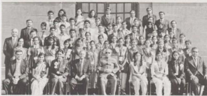
Winners of Tata Building India school essay contest with President Pranab Mukerjee